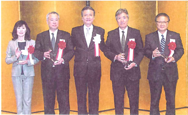
2014年 ダイハツ工業株式会社 仕入先表彰式《ものづくり技術賞》 於:帝国ホテル大阪 2015.5.22